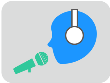
音楽ライブ/トークライブ