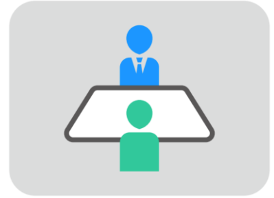
新卒採用イベント