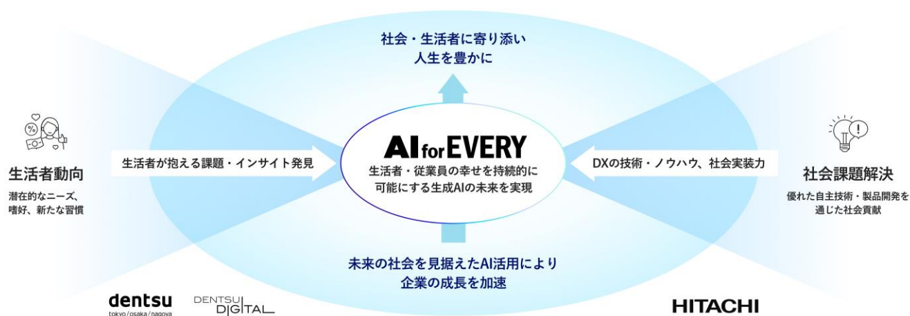
「AI for EVERY」の概要図

今回、最適な顧客体験をデザインし実現する電通・電通デジタルの知見やノウハウと、国内外の多種多彩な領域でDXを実現してきた日立の技術力や開発力を掛け合わせ、社会全体の成長に貢献する新たなサービスを提供していくため、3社は生成AI領域で協業していくことに合意しました。